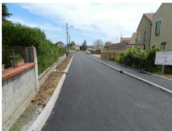
L'Adjoint aux travaux Sébastien PAULET.