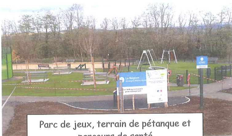
Parc de jeux, terrain de pétanque et parcours de santé