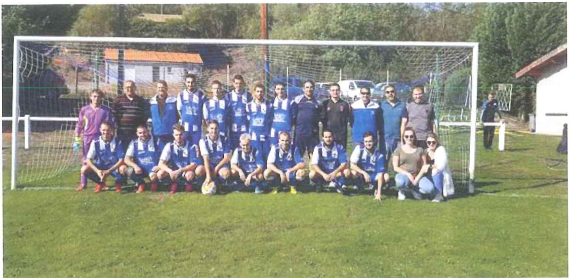
Le Football Club de Charbonnier Les Mines

Et, pour finir, tous les membres du club vous souhaitent une très bonne année 2020 !