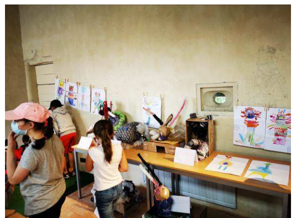
Exposition des élèves visible au château de Villeneuve Lembron.