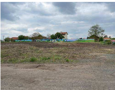
Vue d'ensemble des 2 terrains

Pour tout renseignement, s'adresser en mairie